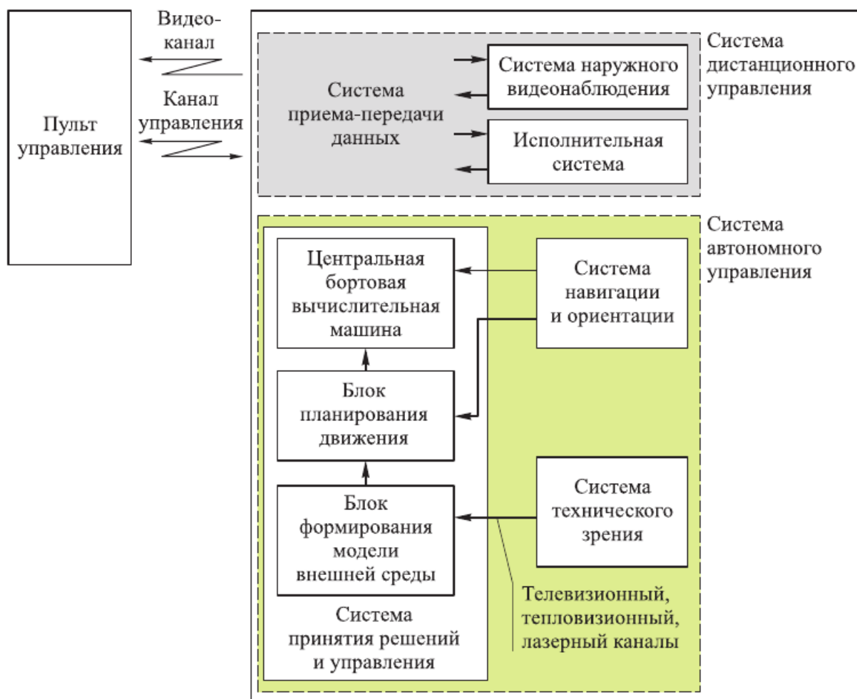
Рис. 2. Обобщенная структурная схема САУД РТК

Важнейшей составляющей РТК является система технического зрения (СТЗ). В подавляющем большинстве случаев СТЗ передает телевизионные (тепловизионные) изображения среды функционирования при перемещении РТК на местности при выполнении различного рода задач.